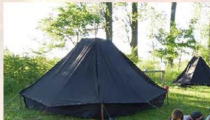
Koh-te aus 4 Zeltbahnen geknüpft, Schlafzelt

Geschlafen wird in kleineren Zelten, den so genannten Koh-ten. Sie bestehen aus vier Zeltbahnen, die zusammengeknüpft werden.