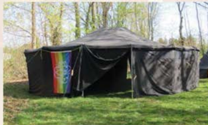
6-er Jurte, Gruppenzelt

Die große Jurte ist unser „Gruppenraum“. Da ist Platz für 20-30 Leute und abends kann man da gut am Lagerfeuer sitzen, Stockbrot essen, Geschichten erzählen, zusammen singen und spielen.